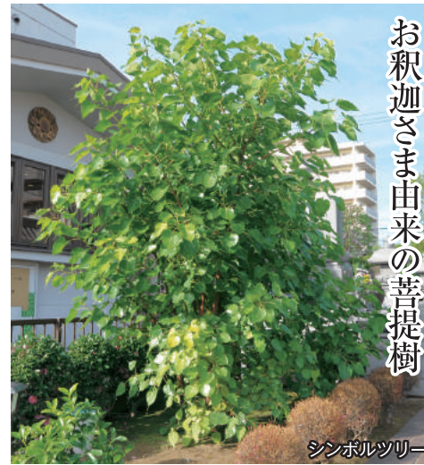
お釈迦さま由来の菩提樹